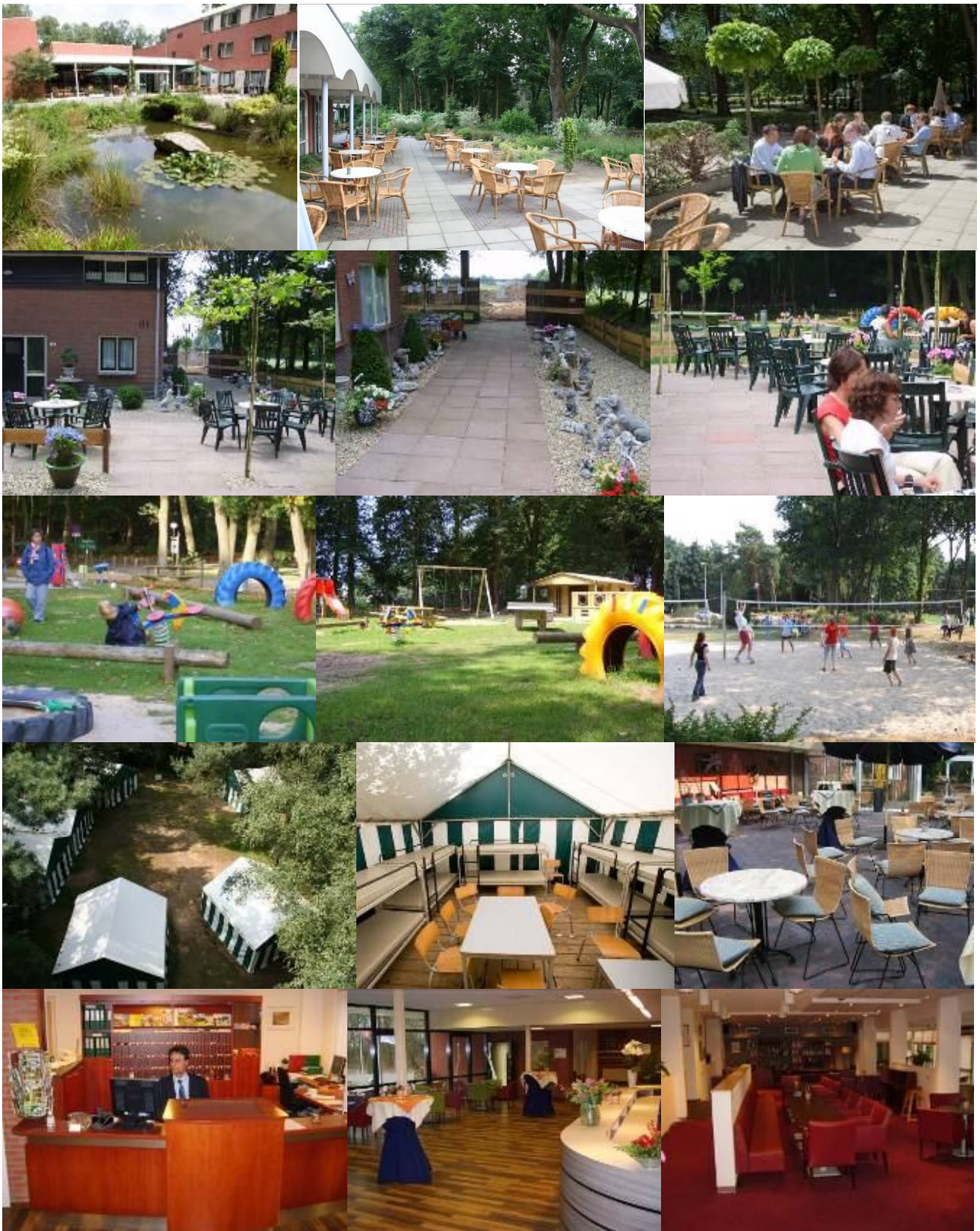
FOTO IMPRESSIE HCC BELMONT