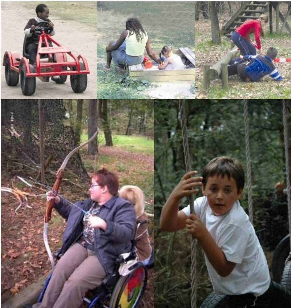
FOTO- IMPRESSIE JOY VAKANTIES