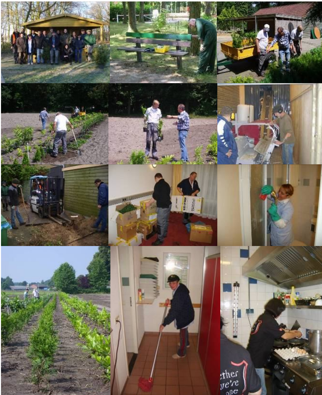
FOTO IMPRESSIE RE- INTEGRATIE